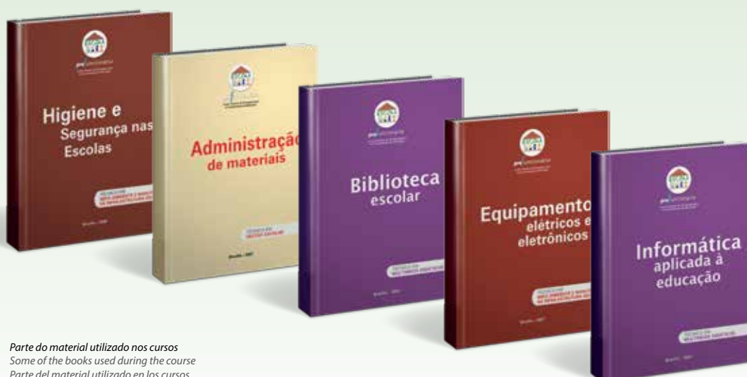
Parte do material utilizado nos cursos Some of the books used during the course Parte del material utilizado en los cursos

El programa se creó en noviembre de 2005 y se implementó por medio de un proyecto piloto en seis estados brasileños: Piauí, Pernambuco, Tocantins, Goiás, Paraná y Mato Grosso do Sul. El proyecto contó con la coordinación de la Secretaria de Educação Básica (Secretaría de Educación Básica, SEB) del MEC después de la realización de un Seminario Nacional, en el que se constató la necesidad de una acción inductora y financiadora de la Unión para que las Secretarías de Educación de los estados ofrecieran los cuatro cursos profesionales del Área de Servicios de Apoyo Escolar. El MEC contó con la experiencia del Centro de Educación a Distancia de la UnB y con varios de sus profesores, que redactaron el material didáctico: seis cuadernos pedagógicos y diez técnicos.